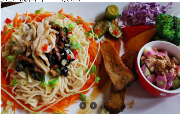
世界幸福咖啡總店-幸福坊