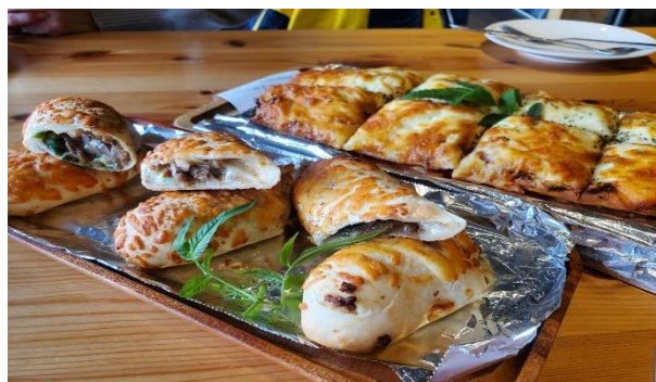
黃金傳說窯烤麵包峨眉十二寮店